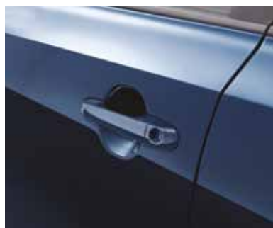
Внешние дверные ручки окрашены в цвет кузова