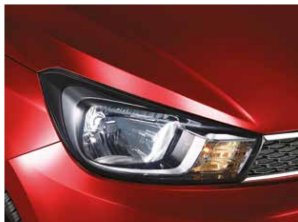
Выразительные передние фары

Спортивные линии кузова создают динамичный силуэт, который не оставляет равнодушным