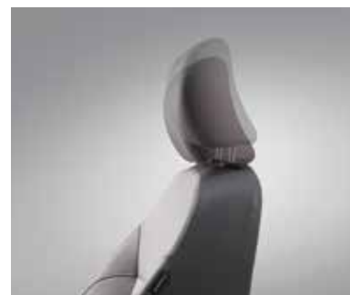
Регулировка передних подголовников по высоте