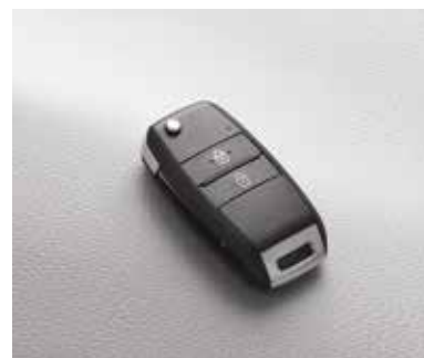
Складной ключ дистанционного управления