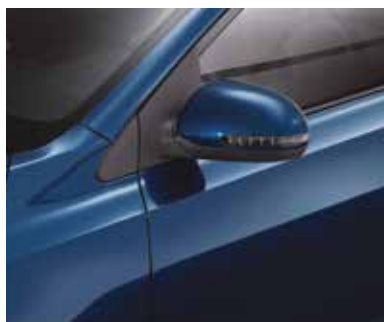
Боковые зеркала с электроприводом и подогревом