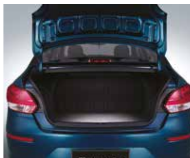
Багажное отделение с подсветкой (475 л)