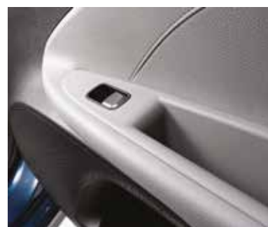
Электростеклоподъемники (всех дверей)