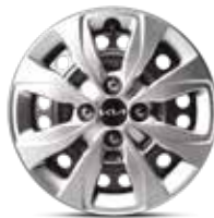
14" Стальной диск