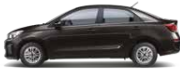
Aurora Black Pearl