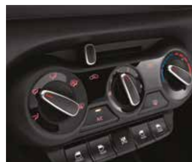
Кондиционер с ручным управлением