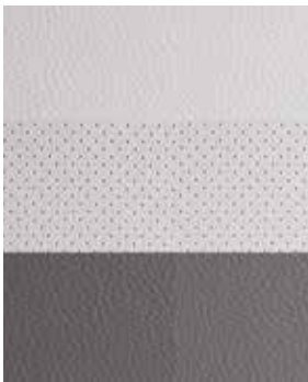
Серая двухцветная кожа