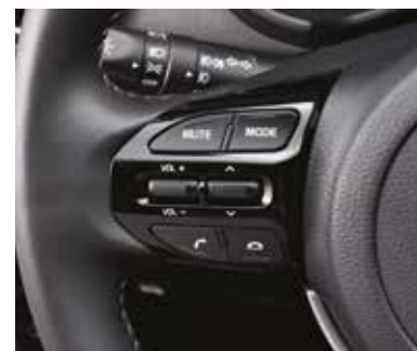
Кнопки управления аудиосистемой на руле