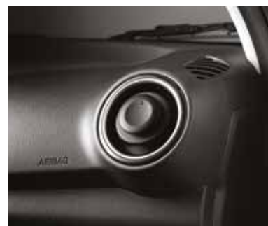
Вращающиеся на 360° дефлекторы