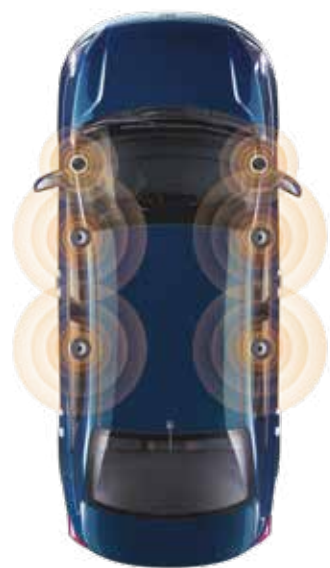
Аудиосистема с 6 динамиками