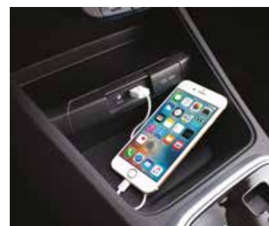
Двухъярусный отсек с портами AUX и USB