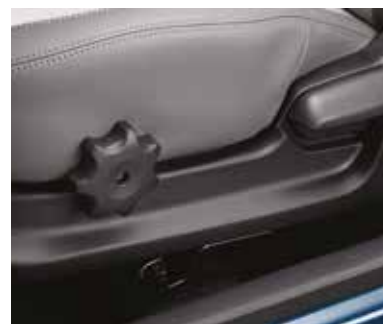
Регулировка угла наклона сиденья водителя