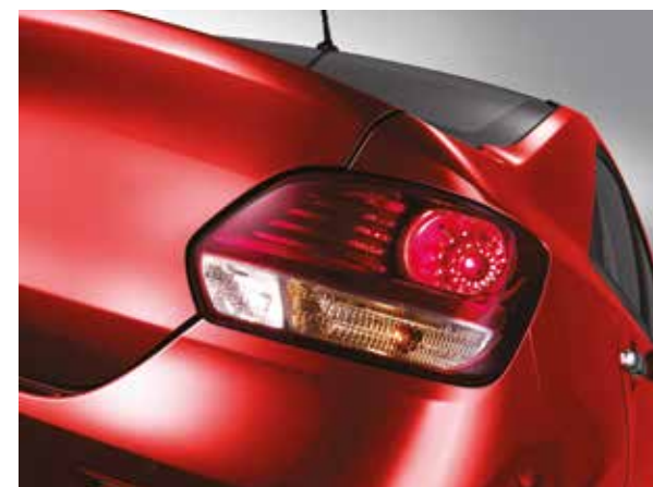
Выдержанный дизайн задних фар