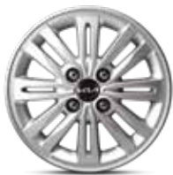
14" Легкосплавный диск